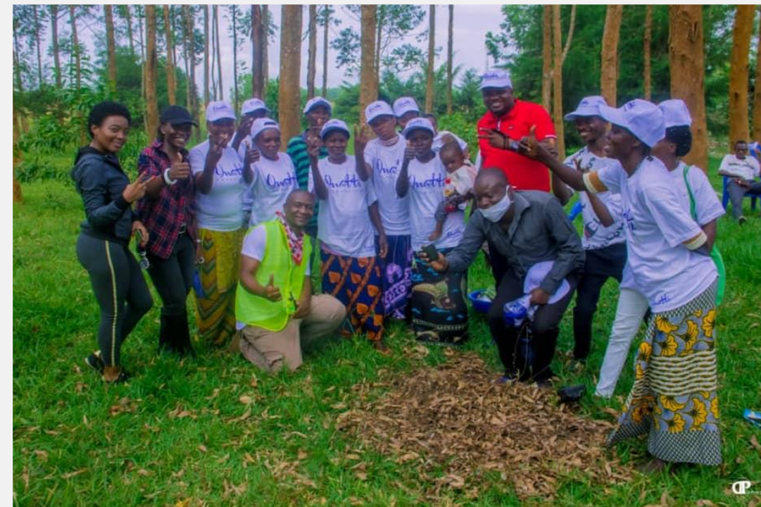
Les maman maraîchères d'Onatti Foundation - Menkao

En fournissant des terres et une formation aux bonnes pratiques agricoles, les femmes feront de l'agriculture une activité commerciale, ce qui leur permettra de gagner leur vie et de subvenir aux besoins de leur famille.