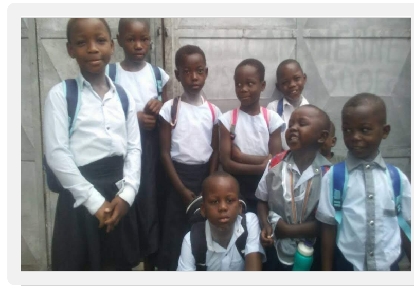
Parrainage des frais de scolarité pour l'orphelinat ESSAV - Sep 2018