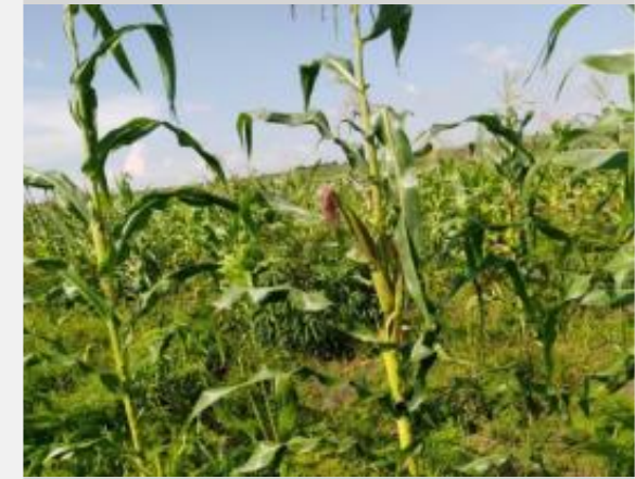
Onatti Terrain dans le village de Nguma - Culture du maïs