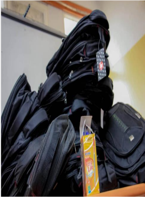
Hospital Kalembe-lembe @ HIV Kids