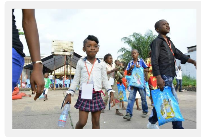
vénement à Kinshasa pour 150 enfants - Jan. 2015