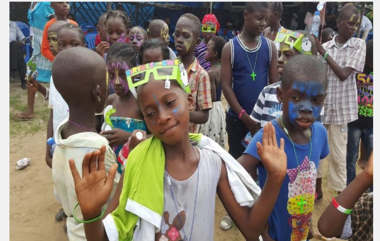
Événement de Noël avec les enfants réfugiés - Déc 2015